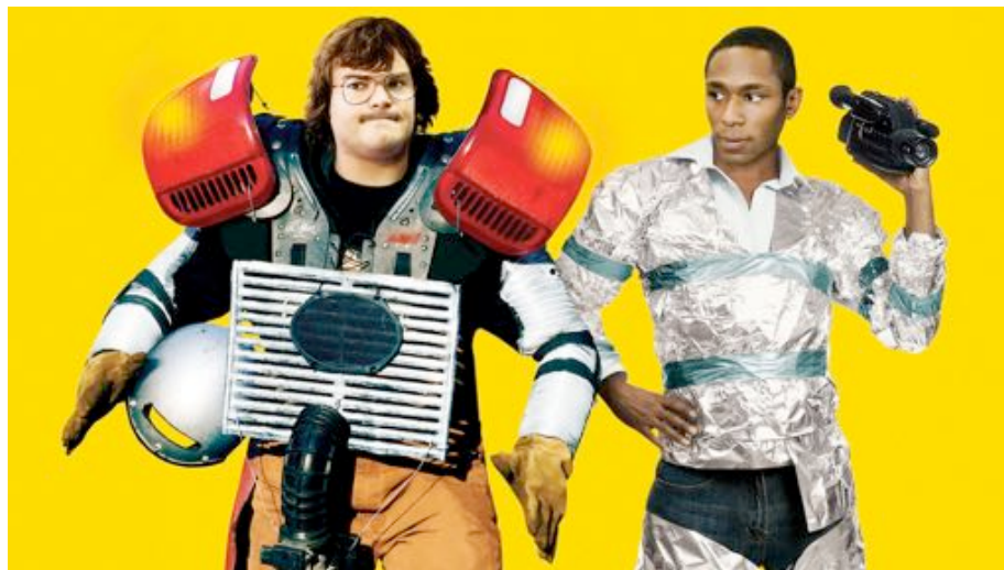
Soyez sympas, rembobinez - Michel Gondry