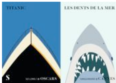
Variations sur les affiches du Titanic et des Dents de la Mer.

Images extraites de films, gabarits, modèles.