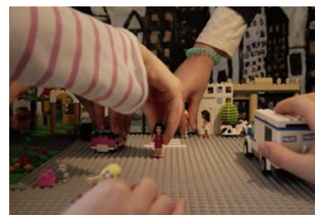
Atelier Brick Film, Centre Equestre du Fénicat de Bruz, mars 2017.