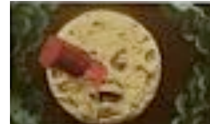
Le Voyage dans la Lune - Georges Méliès

Exploration des techniques de trucage exploitées par Georges Méliès à l'avènement du cinéma.