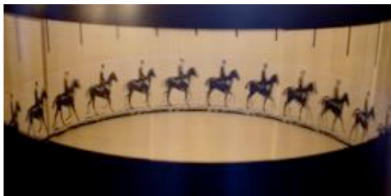
Zootrope - Jument photographiée par Muybridge.

Le zootrope est un objet fonctionnant un peu comme le cinéma. Cette invention est constituée d'une bande de plusieurs images qui sont insérées dans un dispositif de rotation. Quand on fait tourner le zootrope , la bande d'images produit des images successives qui semblent s'animer. Il s'agit d'une illusion d'optique qui donne l'impression d'un film animé.