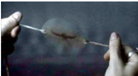
Sleepy Hollow - Tim Burton

Le thaumatrope est un jouet qui date du 19 ème siècle. Il met en évidence un principe visuel qui est la persistance rétinienne. Le thaumatrope est composé d'un disque avec, sur chaque face, une image différente. Lorsqu'on le tourne de façon rapide, les deux images se confondent et ne forment plus qu'une image.