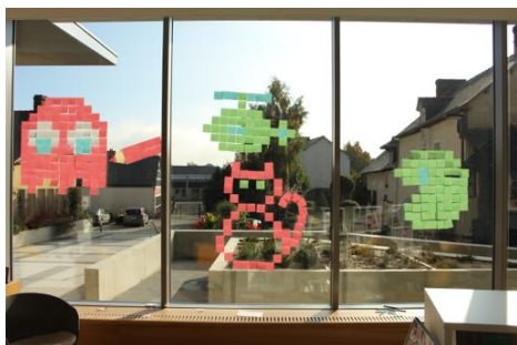
Atelier Pixel Art, médiathèque de la Mézière, octobre 2016.

Création d'un film d'animation en stop motion à partir de post-it.