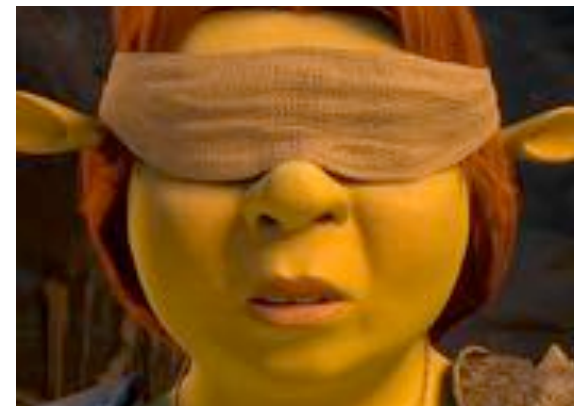
Shrek - Dreamworks

Tester sa culture musicale en trouvant le titre des films à partir des extraits de musique.