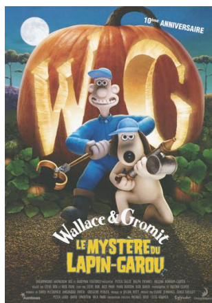
Wallace & Gromit - Nick Park