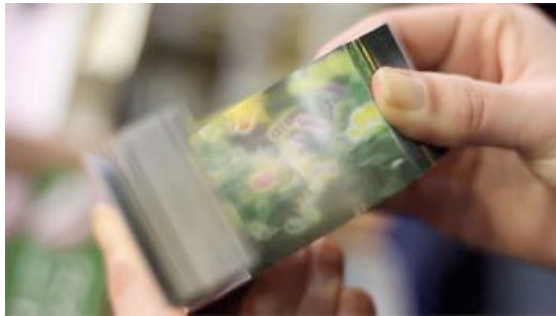
Merry Christmas Flipbook - Mo hitotsu no kenkyujo.

Le Folioscope , aussi appelé Flip Book se présente comme un petit carnet. On le tient d'une main et on l'effeuille de l'autre avec le pouce, de l'avant vers l'arrière ou de l'arrière vers l'avant. Les images ou dessins qu'il contient donnent l'illusion d'être ainsi animés plus ou moins rapidement selon la vitesse à laquelle on le manipule. Ce livre animé, qui décompose le mouvement, permet de comprendre simplement les principes de base du cinéma.