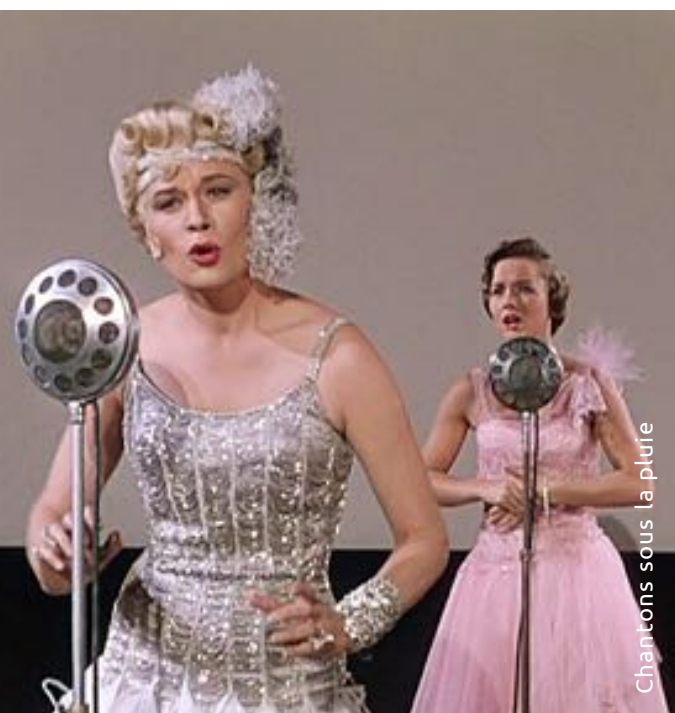
Chantons sous la pluie