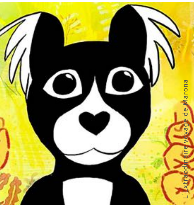
L'Extraordinaire voyage de Marona