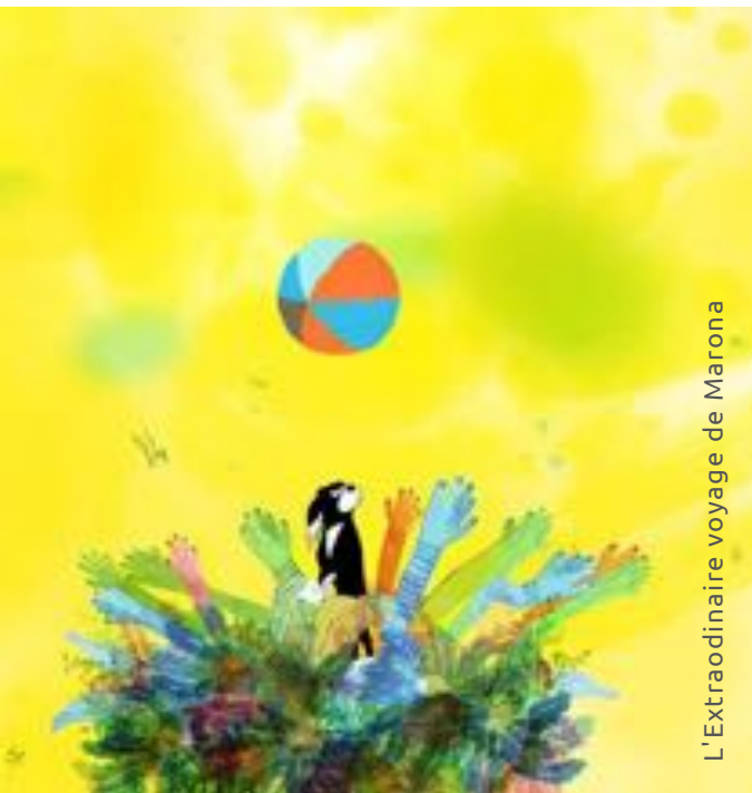
L'Extraordinaire voyage de Marona