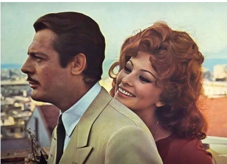
Mariage à l'italienne de Vittorio De Sica

Chaque année, le festival de cinéma de Rennes Métropole invite le public à explorer une ville à travers le prisme du cinéma, révélant les multiples facettes de son identité, de son histoire et de sa culture. Pour sa 38 e édition, Travelling mettra le cap sur Naples , cité fascinante où s'entrelacent passé et présent, splendeur et chaos, réalités et imaginaires.