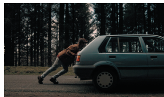
TANT QU'IL RESTERA DU SUPER - EDGAR IMBAULT (PROGRAMME « A L'OUEST ! »)

Projections de courts métrages, rencontres et débats avec des réalisateurs et professionnels, atelier mashup. La magie du cinéma à la portée de chacun !