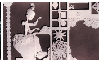
LES TROIS INVENTEURS (PROGRAMME « DRÔLE D'INVENTIONS ! »)