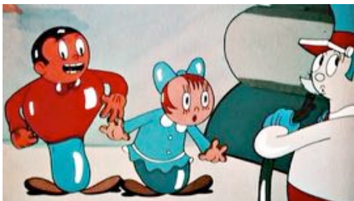
ComiColor de Ub Iwerks (Etats-Unis)

Courts-métrages d'animation d'Ub Iwerks / Etats-Unis / 1934 - 1936 / 55'