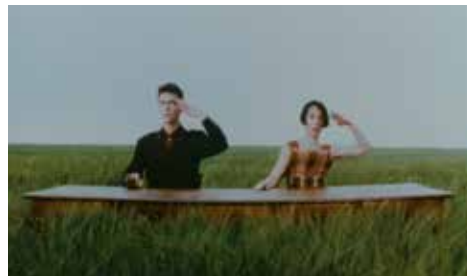
LE P'TIT BAL - Philippe Découflé

De Philippe Découflé à Jean-Pierre Jeunet, en passant par Mathieu Kassovitz, ces courts métrages, réunis dans un programme réjouissant, ont marqué des générations de cinéphiles.